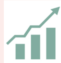
Développement et synergie économique

Loi Climat Résilience du 22/08/2021 (trajectoires ZAN, obligation d'inventaires de ZA, limitation de l'artificialisation des sols )